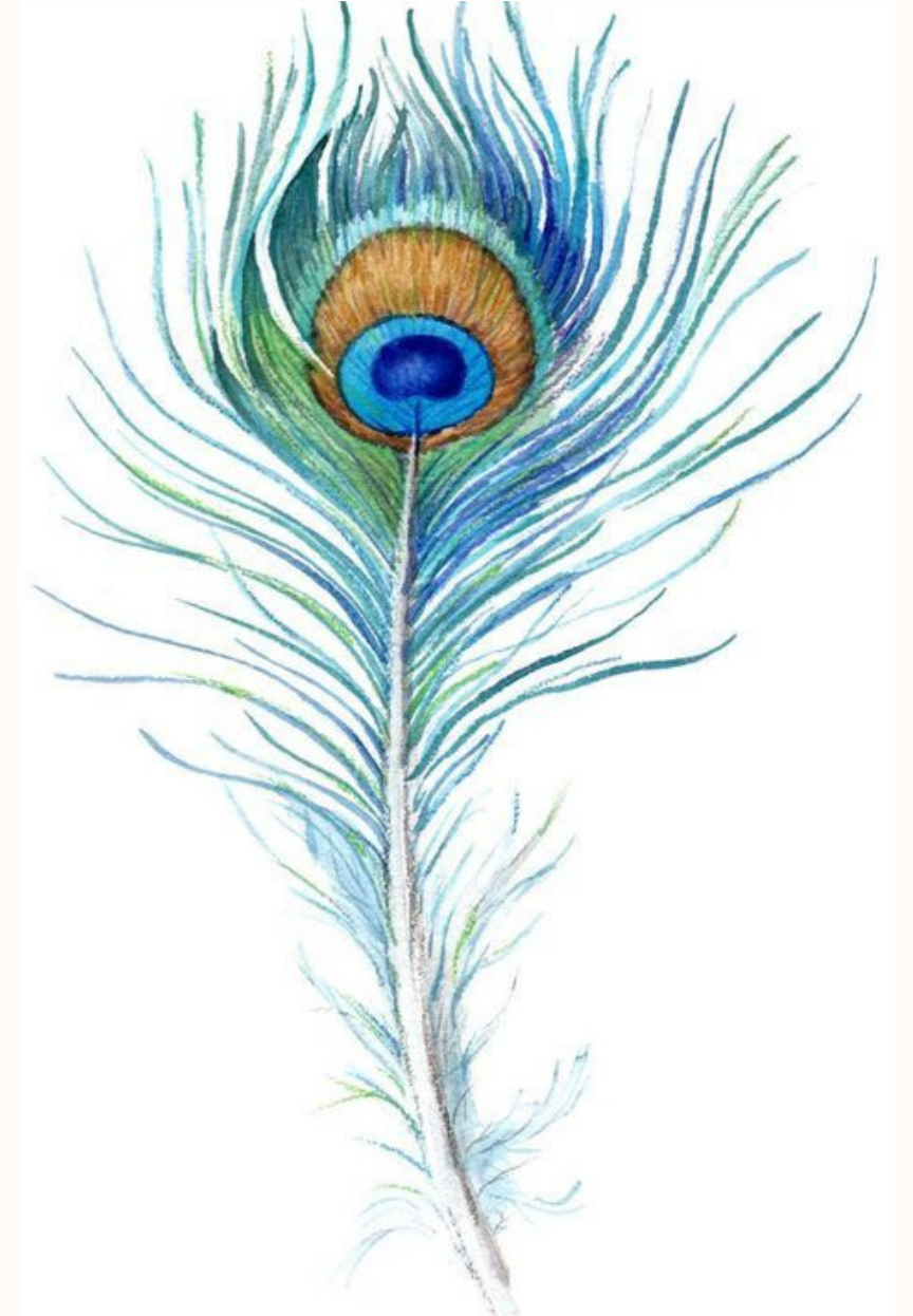
P L U M A D E R E L L E N O