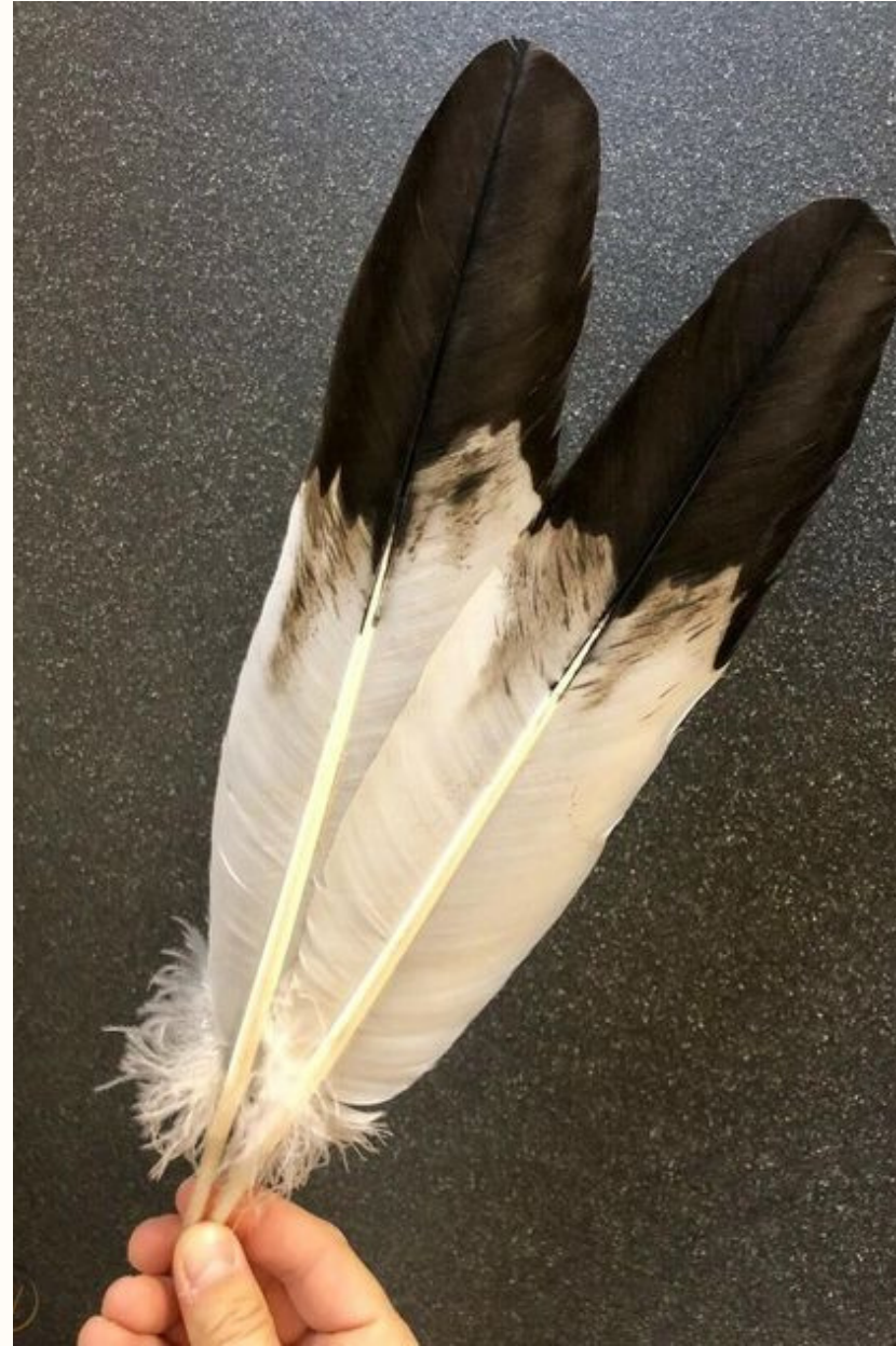
P L U M A D E V A C I A D O