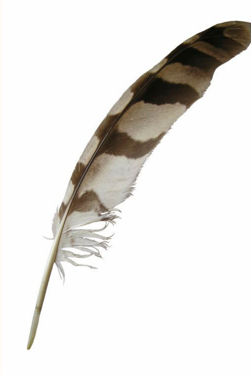
P L U M A D E C O R T E